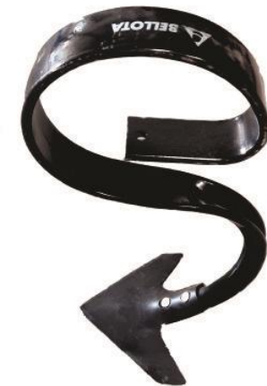
S-образная стойка фирмы «Bellota»