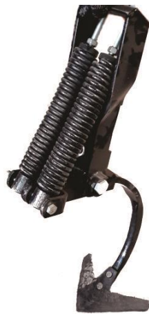
2 предохранительные пружины на каждую стойку