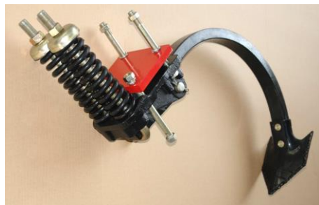
Стойка с чизельной лапой